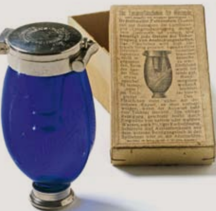
„Blauer Heinrich“ Taschenspucknapf aus blauem Glas